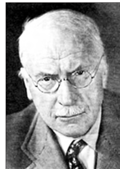
Карл Густав Юнг

Юнг систематизировал свои многолетние практические наблюдения и разработал собственную оригинальную типологию, которую изложил в книге « Психологические типы », увидевшей свет в 1921 году (10-я глава в переводе Е.И. Рузера была издана в СССР в 1924 г.). Юнг ввел понятия психических функций — мышления, чувства, интуиции, ощущения и установок человеческой психики — экстраверсии и интроверсии . Кроме того, Юнг разделил все психологические функции на два класса (две шкалы) — рациональные (мышление и чувство) и иррациональные (интуиция и ощущение). Согласно Юнгу, психика человека асимметрична, так как обычно доминирует одна из функций, а другие функции играют подчиненную, вспомогательную