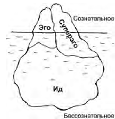
Структура личности по Фрейду

Революционный подход Фрейда к природе и структуре человеческой психики позволил открыть ее сокровенные пласты и описать сложнейший механизм